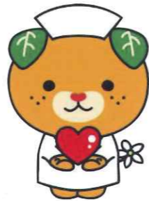
愛媛県イメージアップキャラクター みぎやん