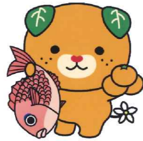
愛媛県イメージアップキャラクター みきゃん